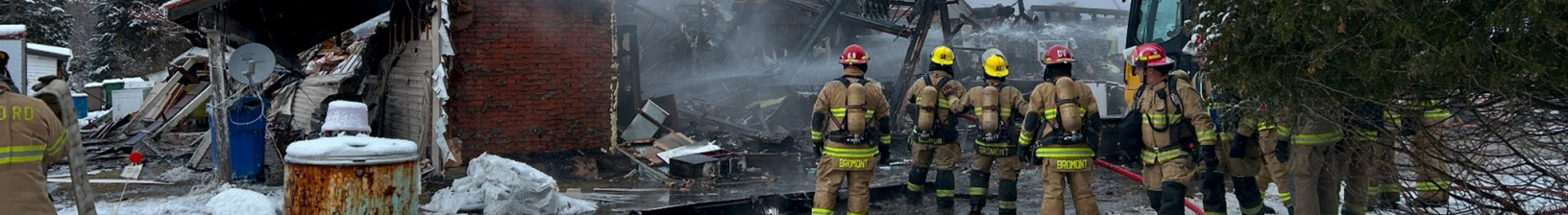
Photo: Incendie du 107, Rue Thibault Sud